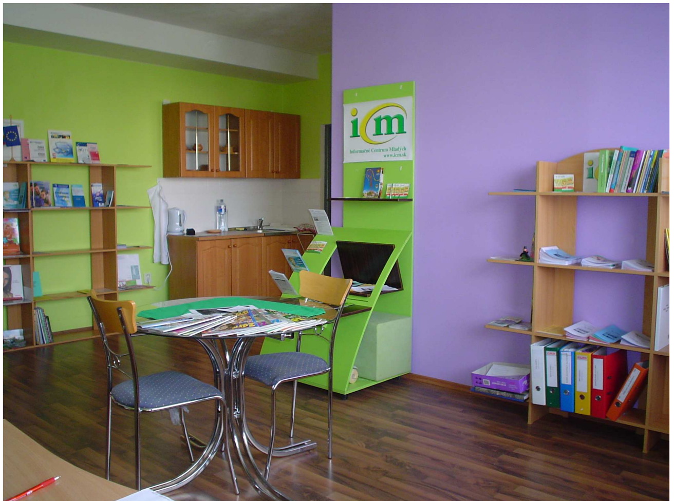
miestnosť v ICM Námestovo určená na infoservis