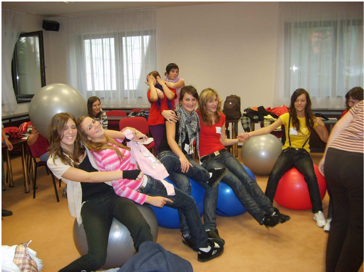
športové popoludnie - cvičenie na fit lopte