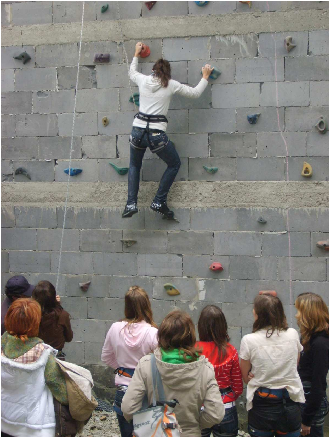
zlaňovanie umelej horolezeckej steny